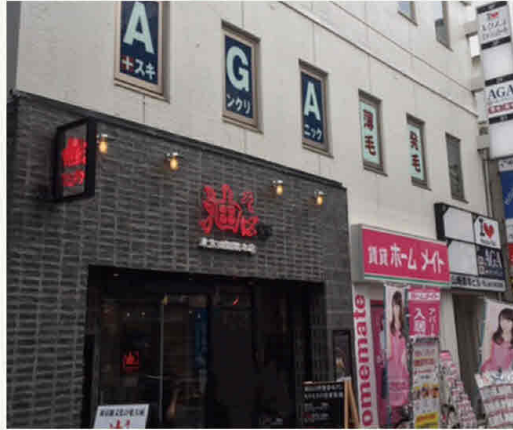
※図面と現況が異なる場合は、現況を優先と致します。

大型商業施設や様々なショップが集結、色々な世代で溢れかえっており高い集客率が見込めます。